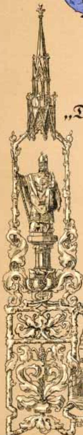
Bischof Albert-Denkmal am Dom (von K. Bernerich).